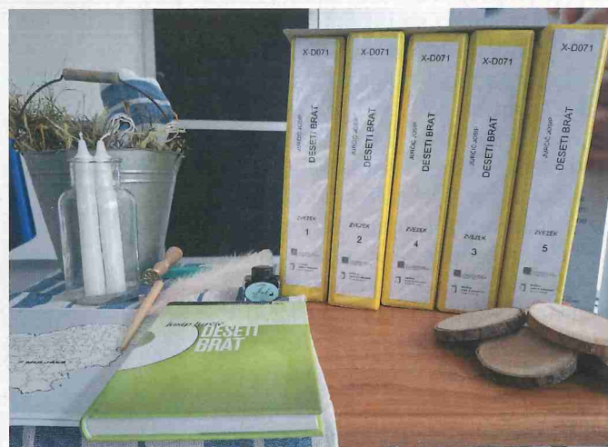
Deseti brat v brajici obsega kar pet zajetnih knjig.

Srečanja so odprta za vse obiskovalce, tudi za tiste, ki z vidom nimajo težav, saj si želijo čim več različnih bralcev in mnenj o prebrani knjigi.